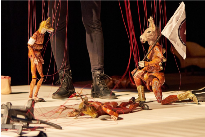
FIMFA LX23 – FESTIVAL INTERNACIONAL DE MARIONETAS E FORMAS ANIMADAS