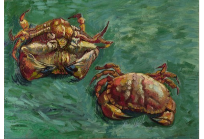
"Dois Caranguejos" Van Gogh, 1889.