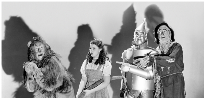
Concerto: O Feiticeiro de Oz (8.dezembro - Fundação Gulbenkian)