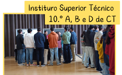
T3 - 10ºA e 10ºB