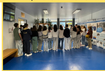
Exposição Água Vai, Museu da Cidade - 8º Ano