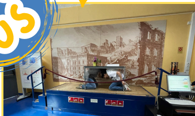
Instituto D. Luiz, Universidade de Lisboa - 7º Ano